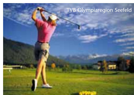
TVB Olympiaregion Seefeld

Bewegung und Sport sind vor der beeindruckenden Naturkulisse der Tiroler Bergwelt keine Grenzen gesetzt. Allein drei Golfplätze warten in der unmittelbaren Umgebung unseres Hauses. Über 200 km Forstwege und Trails bieten freie Fahrt für Radfahrer und Mountainbiker. 650 km markierte Wander-, Berg- und Klettersteigtouren wollen bezwungen werden und für Tennisfans stehen 10 Hallen- und 17 Freiplätze zur Verfügung.