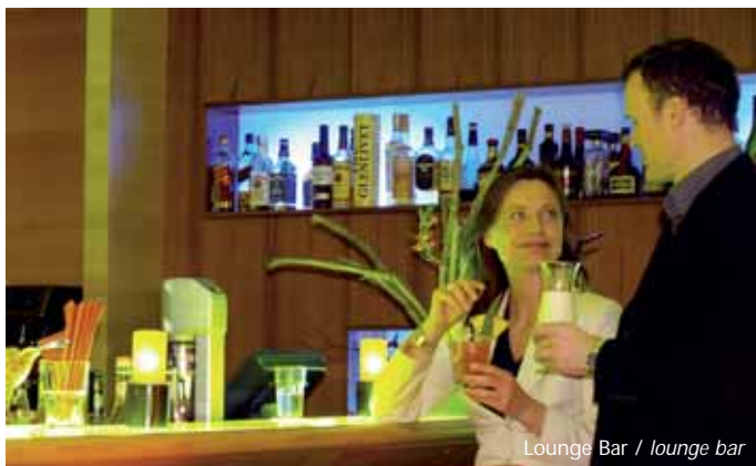
Lounge Bar / lounge bar