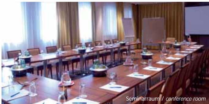
Seminarraum / conference room