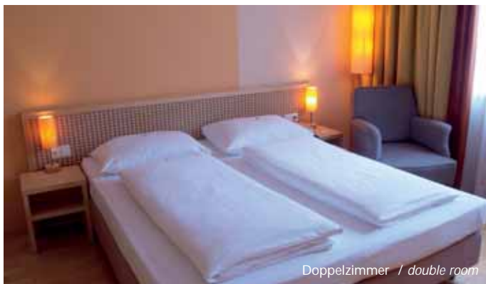
Doppelzimmer / double room