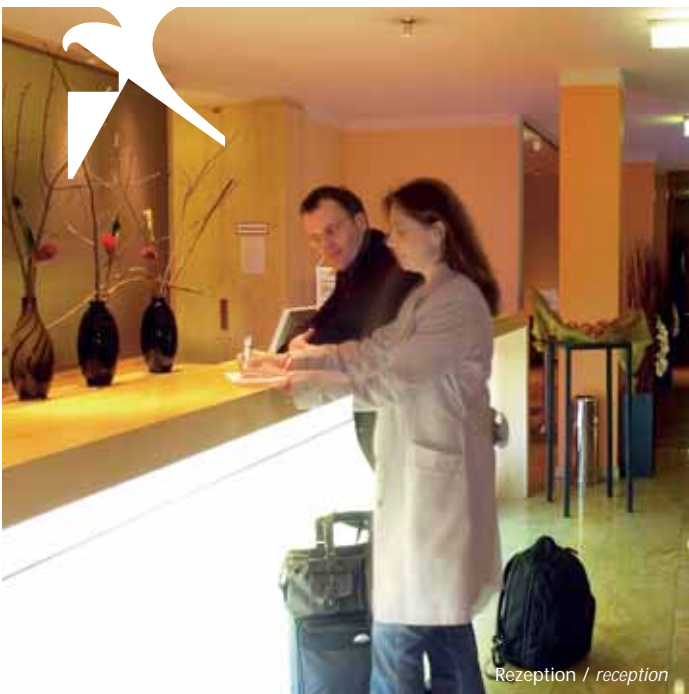
Rezeption / reception