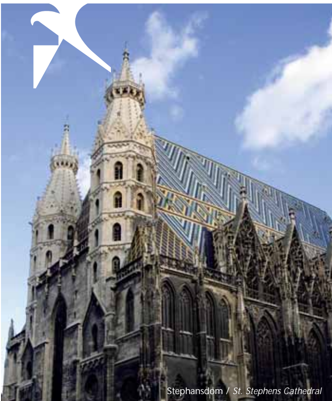
Stephansdom / St. Stephens Cathedral