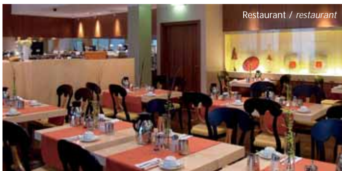
Restaurant / restaurant