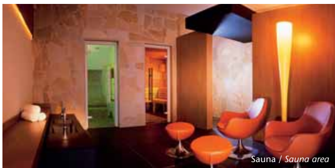
Sauna / Sauna area