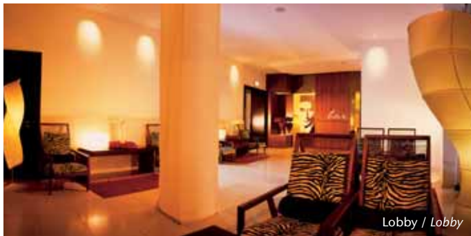
Lobby / Lobby

The newest City-Hotel in the Falkensteiner group can be found in the heart of the Czech capital. Not far from Wenceslas Square, the Hotel Maria Prag **** perfectly reflects the magnificent location that Prague has always been. Its facade of classical splendour conceals an interior characterised by innovative design and fittings. Even during the time of the Austro-Hungarian Empire, Kafka's hometown had a clandestine intellectual side. Come and discover the contrasts of today's Prague. A global city, but a city proud of its past.