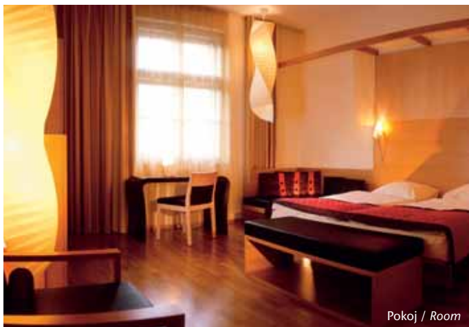
Pokoj / Room