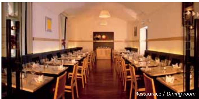
Restaurace / Dining room