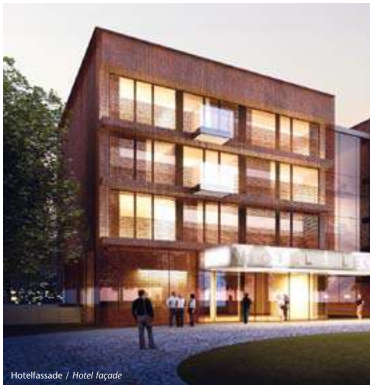
Hotelfassade / Hotel façade