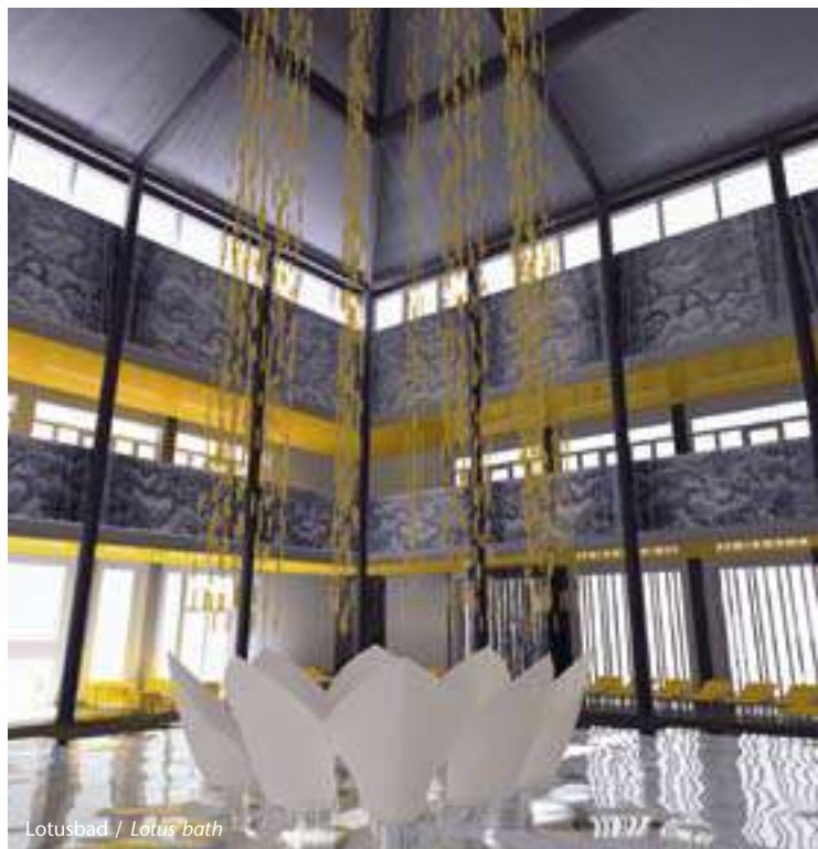
Lotusbad / Lotus bath