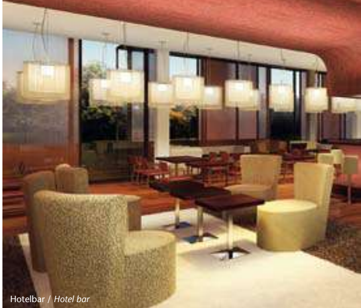
Hotelbar / Hotel bar

Mit dem neuen Falkensteiner Hotel & Asia Spa Leoben gehen wir in unserem erfolgreichen City-Konzept einen Schritt weiter. Ein modernes Stadt-Hotel, perfekt zugeschnitten auf die Bedürfnisse von Businessreisenden und Tagungsgästen mitten im grünen Herzen Österreichs: innovative Architektur, atemberaubendes Ambiente, moderne Tagungsräume und ein multikulturelles Flair. Daran angeschlossen ein exklusives Asia Spa mit getrennten Bäder- und Poolbereichen für alle Erholungssuchende. Diese Kombination macht das Hotel auch für den Feriengast zu einer ganz besonderen Destination!