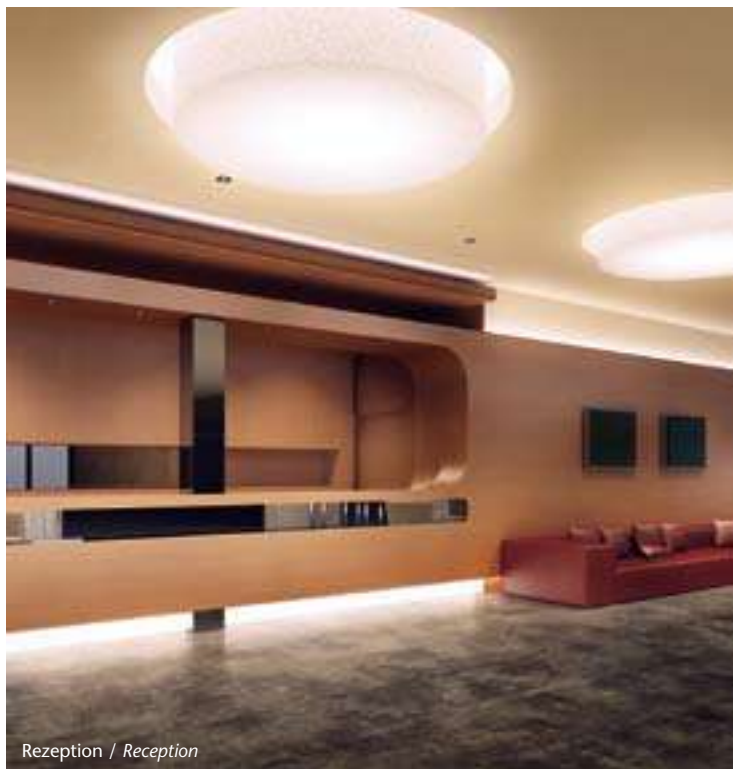
Rezeption / Reception