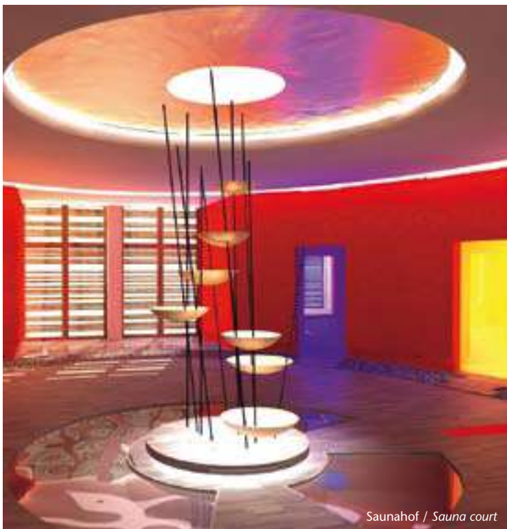
Saunahof / Sauna court