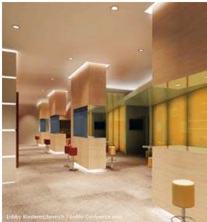
Lobby Konferenzbereich / Lobby Conference area