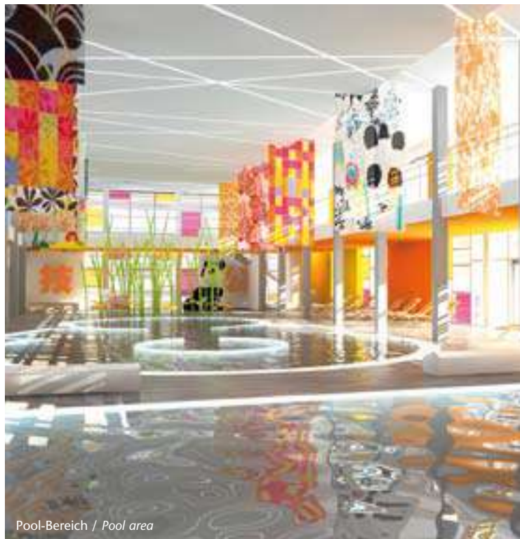
Pool-Bereich / Pool area