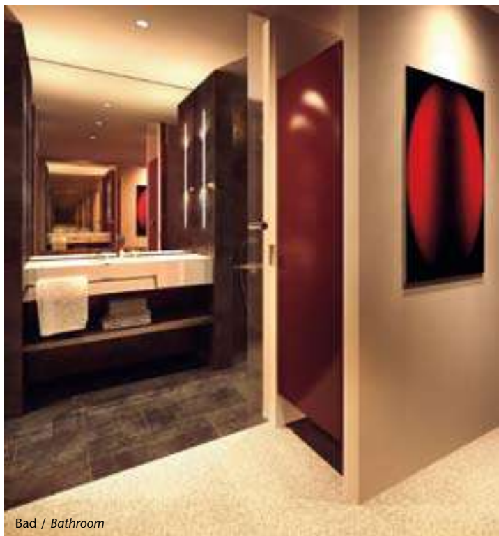
Bad / Bathroom