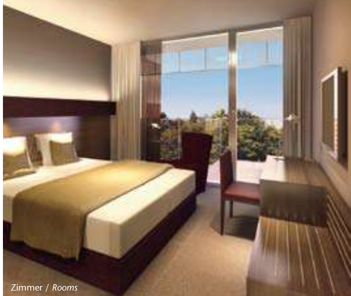
Zimmer / Rooms