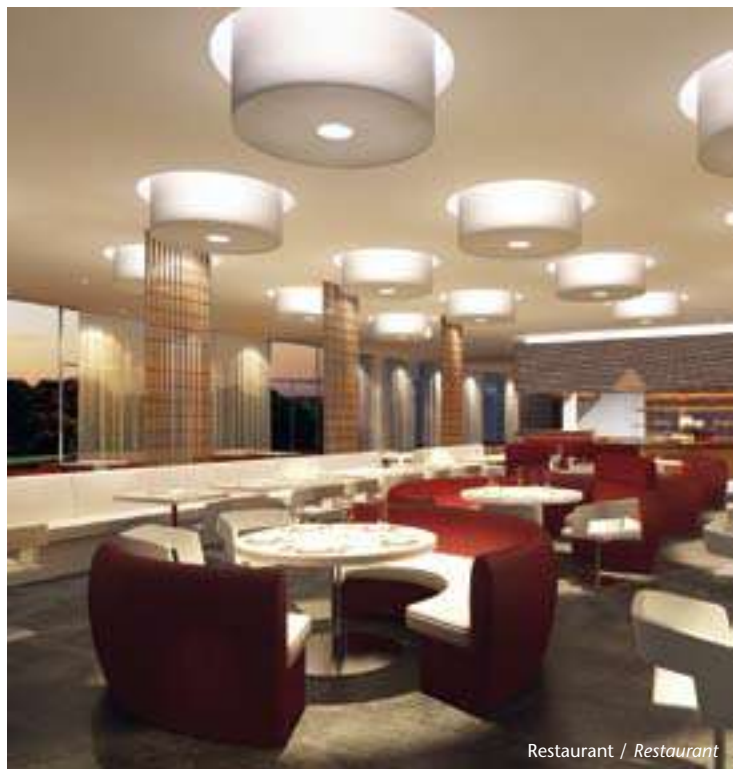
Restaurant / Restaurant