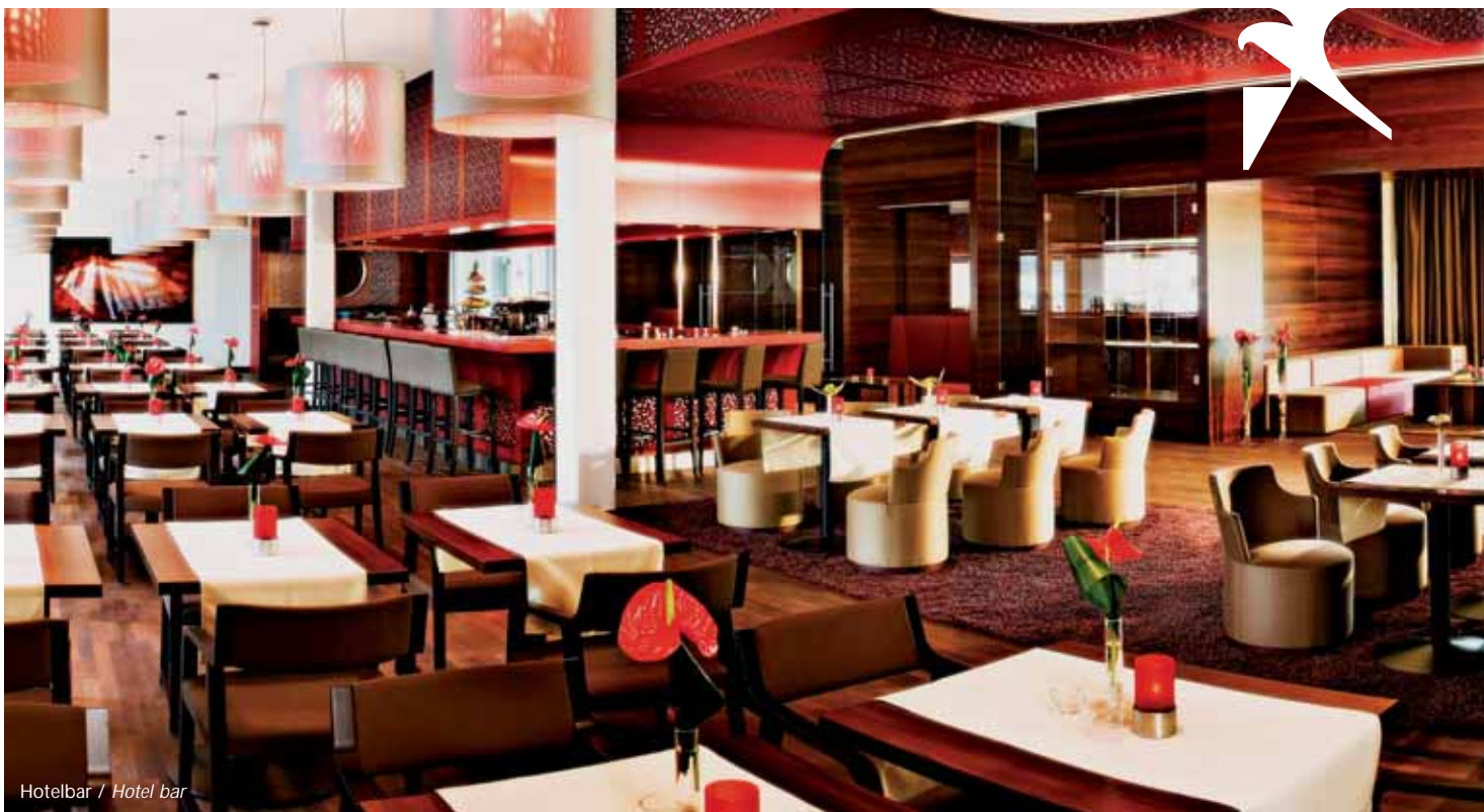
Hotelbar / Hotel bar