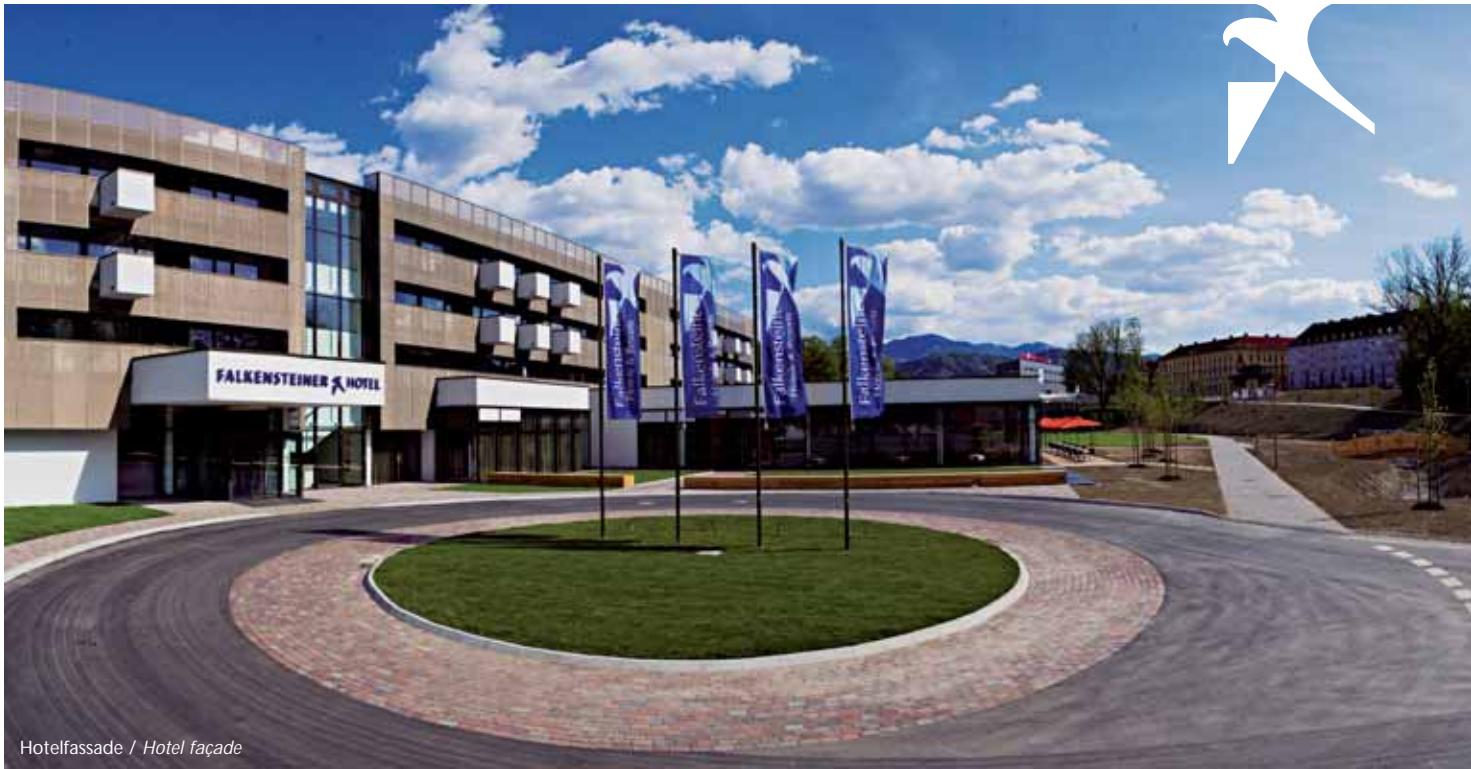
Hotelfassade / Hotel façade