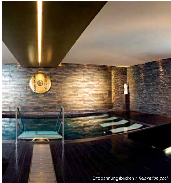
Entspannungsbecken / Relaxation pool