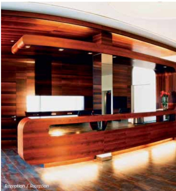
Rezeption / Reception