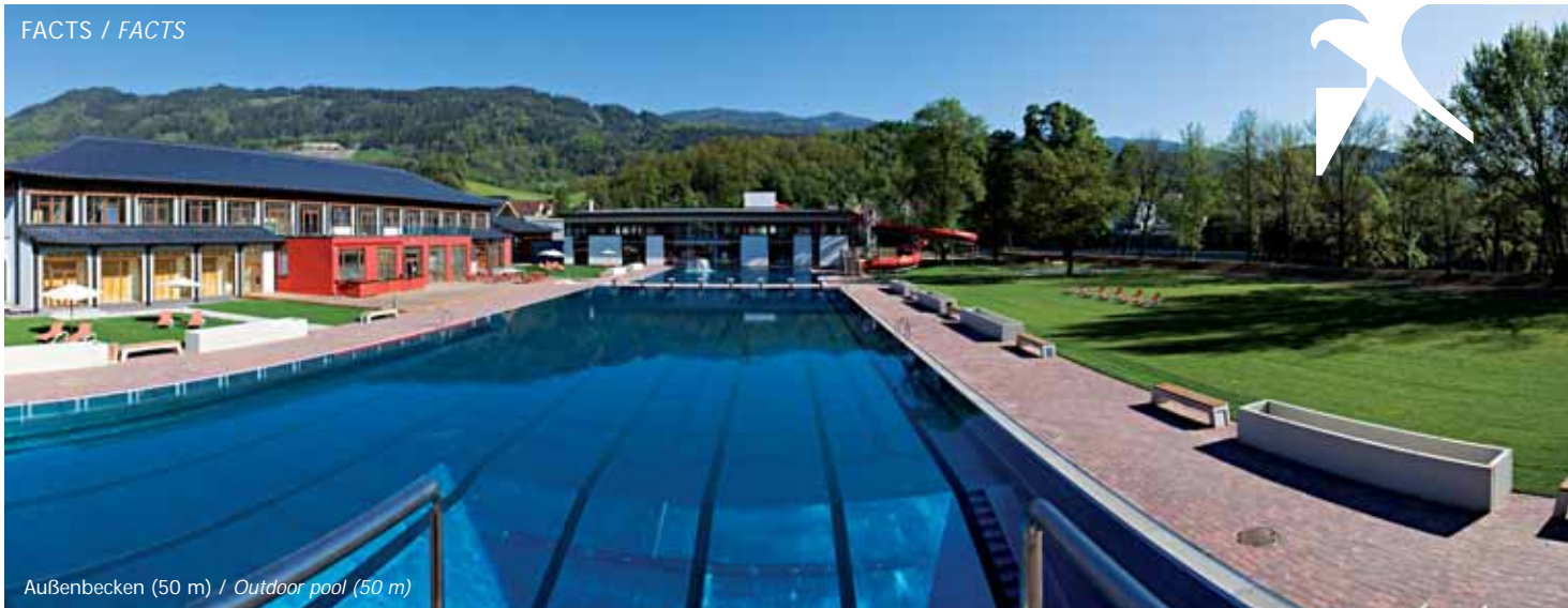
Außenbecken (50 m) / Outdoor pool (50 m)