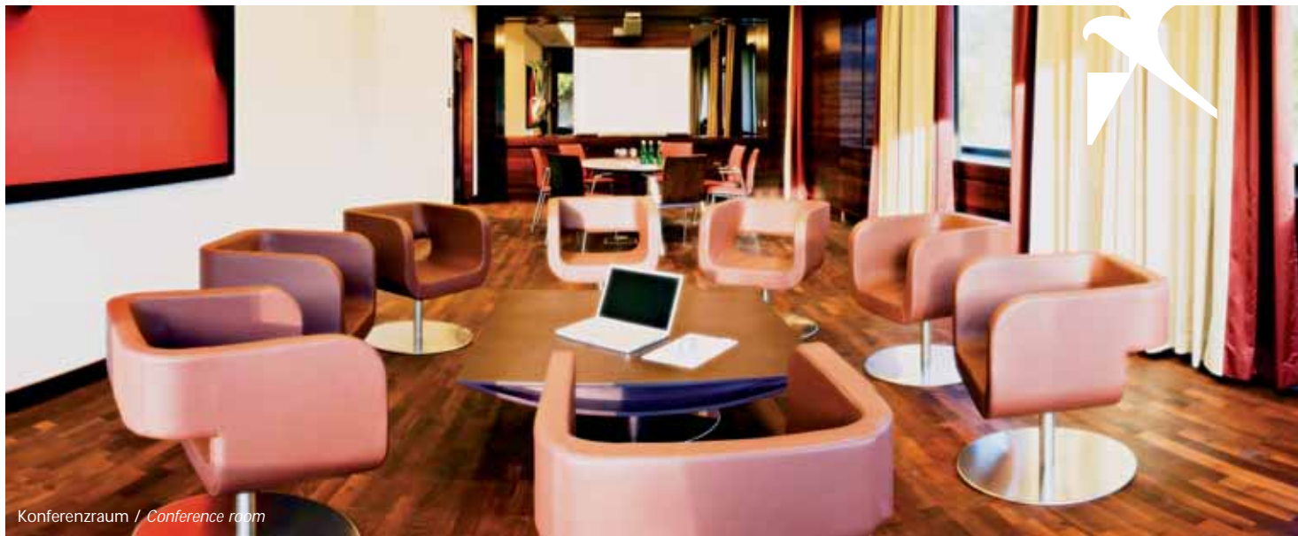
Konferenzraum / Conference room