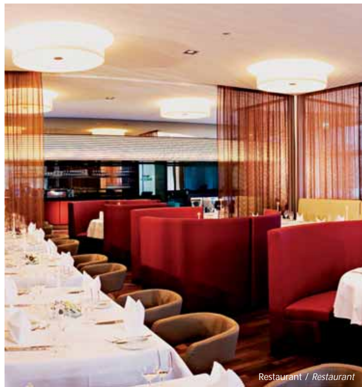
Restaurant / Restaurant