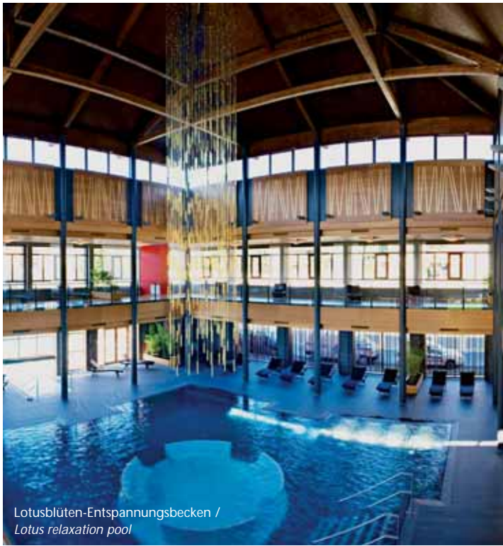
Lotusböten-Entspannungsbecken / Lotus relaxation pool