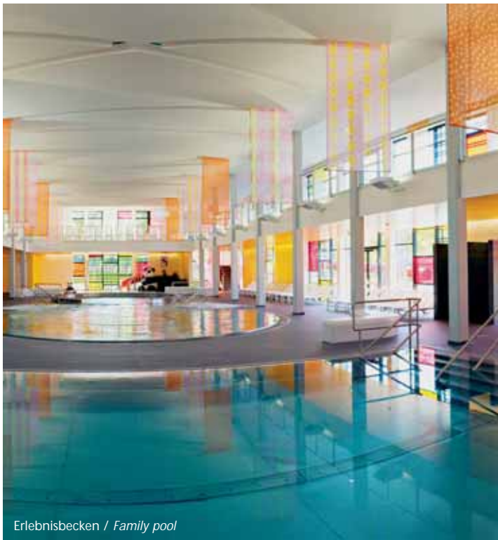
Erlebnisbecken / Family pool