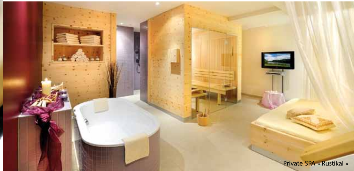
Private SPA » Rustikal «