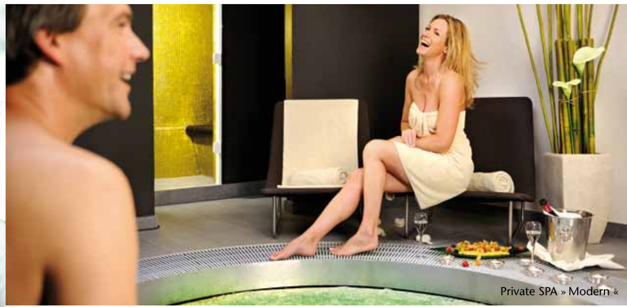
Private SPA » Modern «